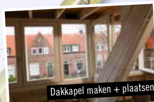
Dakkapel maken + plaatsen

Radek Legal heeft een top verzekeringspakket. Onverhoopte ongevallen zijn altijd volledig gedekt.